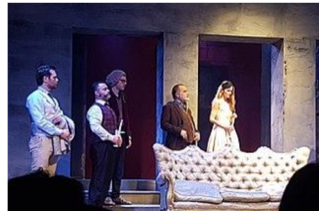
Shakespeare's Hamlet, directed by Levan Tsuladze, Anessis Theatre, Athens.

Peu de productions ont une image dans Wikidata et Wiki Commons. Distinguez-vous en ajoutant la vôtre.